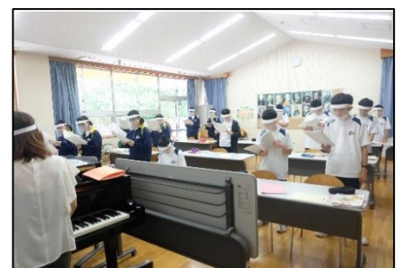
▲ フェイス・シールド着用での音楽の授業

また、音楽の授業ではフェイス・シールドを着用して、合唱の練習に取り組み始めました。4校交流での合唱コンクールは残念ながら中止となってしまいましたが、本校のみであれば、十分な感染症対策をとることで、全校合唱が可能と捉えています。「広陵祭」での発表にどうぞ御期待ください。