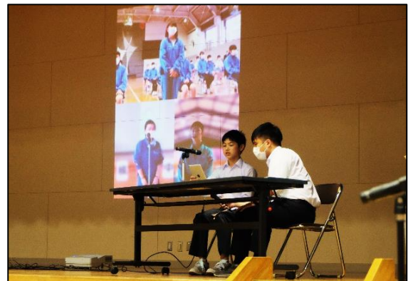
▲ リモートでの感想発表

当日は、各校が作成した学校紹介の動画を、インターネットを活用してそれぞれの学校で視聴しました。その後、各校の代表生徒がスカイプを使用して感想を発表し合いました。インターネットを活用し、離れていながらも他校との交流ができたことは、生徒たちにとっても新鮮な体験になったことと思います。