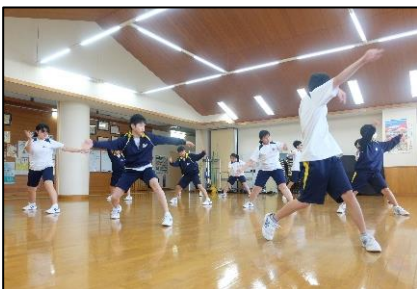
▲ 広陵ソーランの練習

本校の文化祭「広陵祭」は、9月5日（土）に開催の予定です（感染症予防の観点から来賓を制限する方向で計画しています。）生徒による実行委員会も発足し、様々な準備や練習がスタートしました。